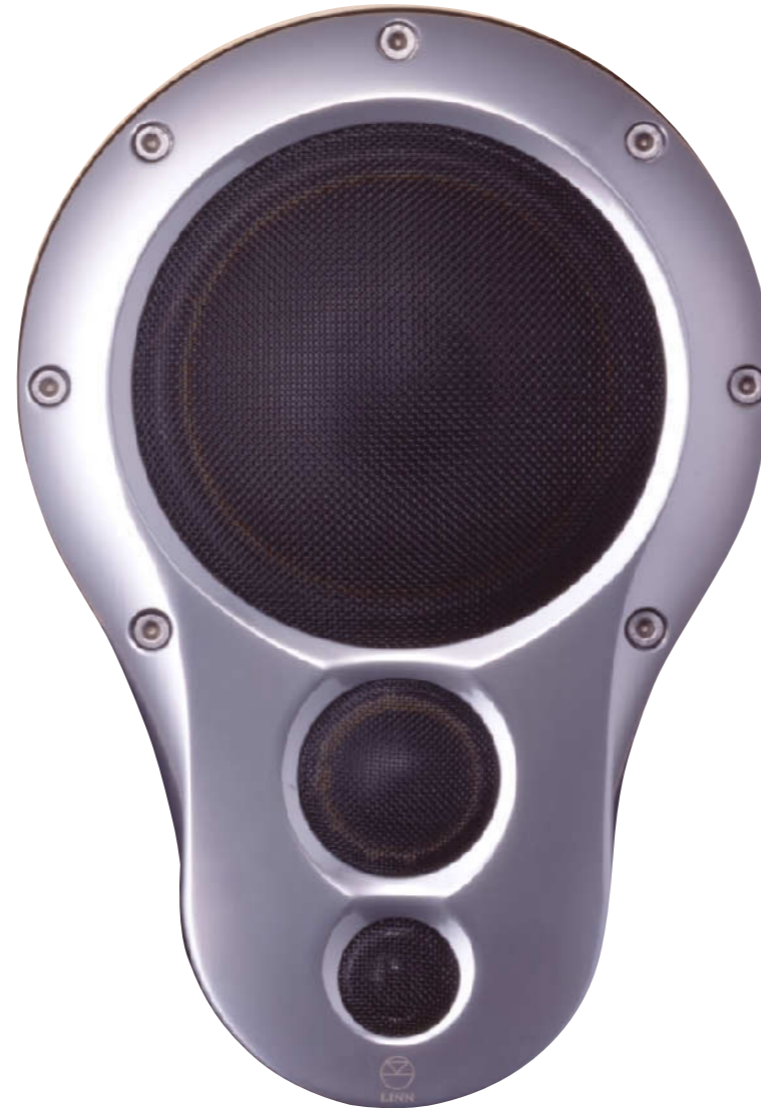
3K DRIVER ARRAY