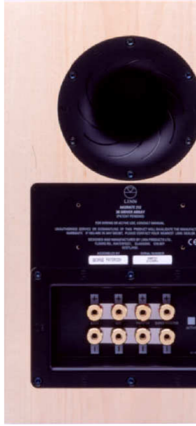
[AKURATE 212] リアバツフル

スピーカーシステムを優れたものとして実現させるには、様々なトレードオフにある条件を一つひとつクリアし、総合的に音質を追求しなくてはなりません。AKURATE シリーズには、多年にわたる総合オーディオメーカーとして蓄積されたノウハウとアイデアが結実しています。ミュージカリティに優れた低音再生を実現し、3K DRIVER ARRAY を名実ともに支える、3層コーンによるオリジナル設計のベースユニット。キャビネット内部と外部の音響インピーダンスを整合させ、ポートノイズの発生しないダブルフレア・バスレフポート。KOMRI 同等の加速度検知型サーボシステムを備えたAKURATE 221。マルチワイヤリング、マルチアンプによるアクティブ駆動にも容易に設定変更可能な入力端子部等々。そうした高音質のためのテクノロジーの全てを、高級天然ツキ板で、エレガントに仕上げられた工作精度を誇るエンクロージャにさりげなく収めています。メイブルの他、全機種ともにチェリー、ローズナット、ブラックの4タイプの仕上げをご用意。付属のグリルを活用すれば、インテリアとの親和性も高く、置かれた空間のクオリティをも向上させるようなヴァーサタイルな魅力をAKURATE シリーズは備えています。